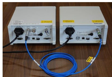
Output1 から右側の EMF520R 型電位計の Detector 端子へ接続した例