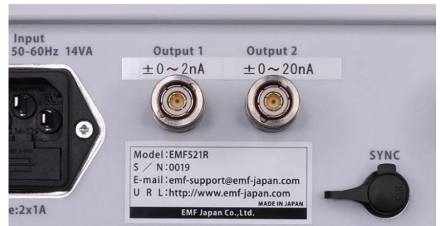
Output1 と Output2 の 2 つの出力端子があります。

専用ケーブルの反対側の端子を電位計の Detector 端子へ接続すると自分自身の電位計の測定精度を点検することができます。同様に他の電位計へ接続してその電位計の測定精度を点検することもできます。さらにリニアック室と操作室の間に敷設された延長ケーブルの健全性を点検することも可能で、電荷発生装置は放射線治療部門における必需品と言えます。