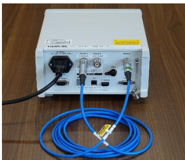
Output1 から自分自身の Detector 端子へ接続した例

弊社が保証できる性能は仕様に記述された範囲です。個々の製品の性能については出荷時に実測した検査成績書が製品に添付されていますので、そちらをご確認下さい。