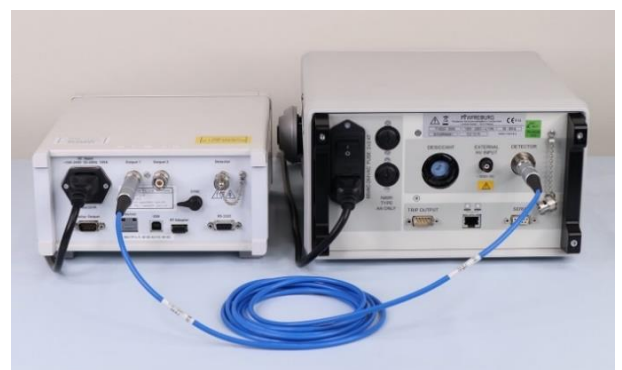
Output1 から他社の電位計へ専用ケーブルで接続した例