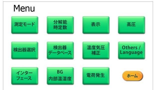
Menu 画面で「電荷発生」を押すと下記の画面へ替わります。